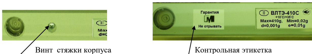
Рисунок 2 - Схема пломбирования от несанкционированного доступа

Для защиты весов от несанкционированной настройки и вмешательства, которые могут привести к искажению результатов измерений, весы пломбируются поверх одного винта стяжки корпуса контрольной этикеткой изготовителя. Схема пломбирования и обозначение места нанесения знака поверки представлены на рисунках 2 и 3, соответственно.