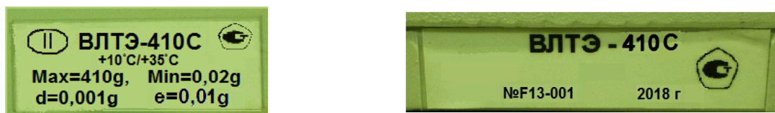
Рисунок 4 – Маркировка весов

Серийный номер и буквенно-цифровое обозначение весов приведены на двух табличках, закрепленных на корпусе весов методом наклейки.